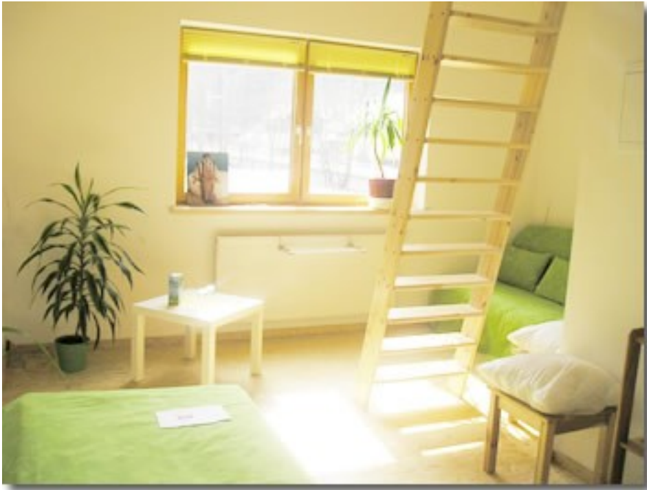
Abbildung 5: Gästezimmer