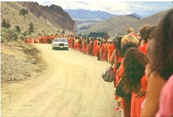
Abbildung 2: Osho bei seinem täglichen Drive By