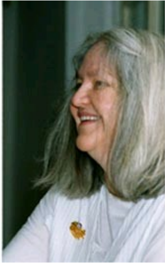
Abbildung 3: Mahamudra