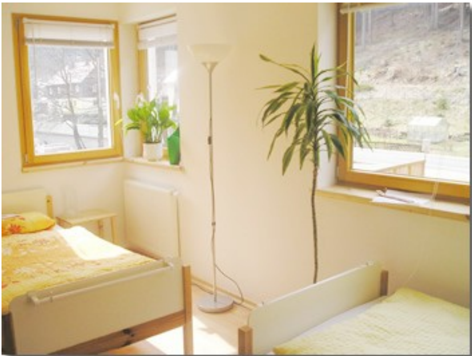
Abbildung 6: Gästezimmer