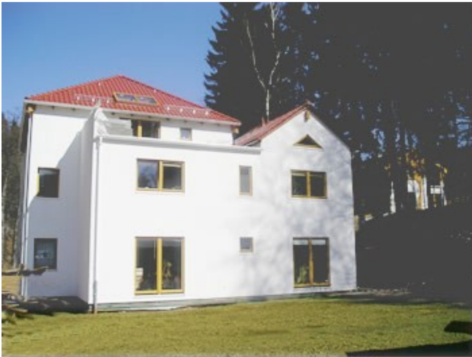
Abbildung 4: Das Haupthaus der Kommune